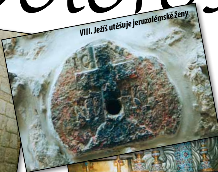
VIII. Ježíš utěšuje jeruzalémské ženy