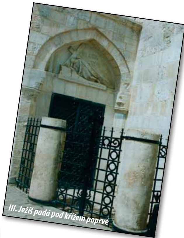
III. Ježíš padá pod křížem poprvé