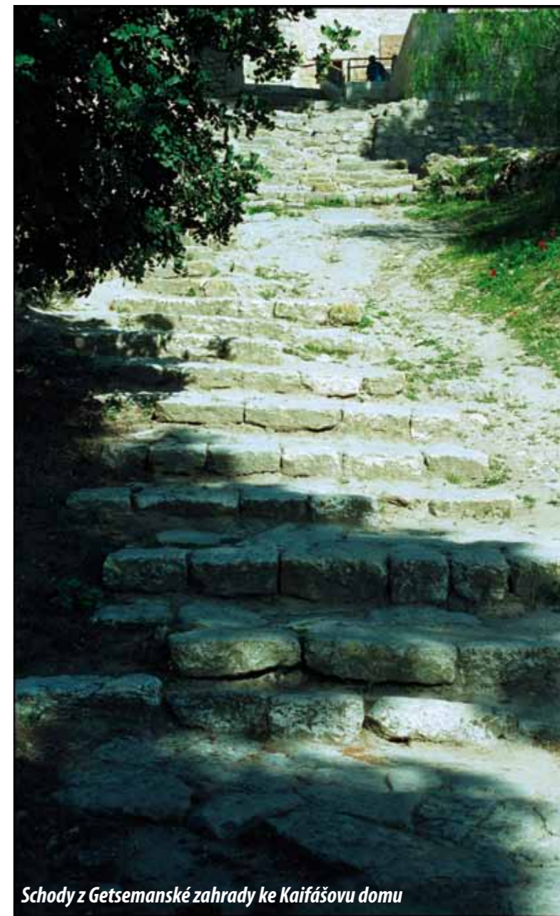
Schody z Getsemanské zahrady ke Kaifášovu domu

Díky tomuto pohnutému příběhu z roku 70 po Kristu se tedy nyní objevují v podzemí peníze různých měn, které pocházejí jakožto platidla již od dob Hasmonejců či Heroda Velikého. Proto jsem letos i já mohl v „českých rukách“ držet stříbrný denár s portrétem i nápisem císaře Tiberia, minci, kterou možná i držel v ruce sám Pán Ježíš, když si ho v chrámu vyžádal, aby ukázal svým