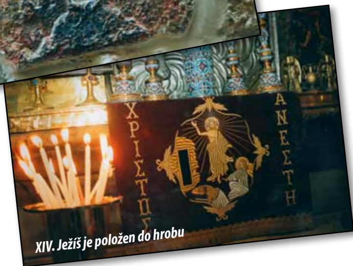
XIV. Ježíš je položen do hrobu