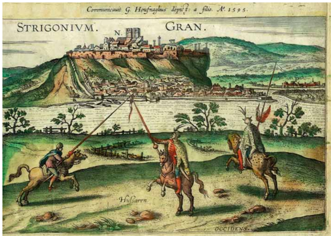
Joris Hoefnagel: Ostrihom v roce 1595

Prvá hodnoverná písomná zmienka o prítomnosti Rádu sv. Lazara v Uhorsku pochádza z metačnej listiny z r. 1181, v ktorej sa spomína „ una separat terrae Dorogh, alia Cruciferorum Sancti Lazari “ [2], akési osobitne vyčlenené územie menom Dorogh inak tiež označované ako zem Križovníkov sv. Lazara. Dorog je mestečko v Komárňansko-ostrihomskej župe a uvedená metačná listina je zároveň prvou písomnou zmienkou o tejto obci. Lepra bola známa v Uhorsku najneskôr od pol. 11. storočia o čom existujú spoľahlivé záznamy v diele zo života sv. Gerárda, čanádskeho biskupa. Hospice a najmä leprosária vznikali obvykle za hradbami väčších miest a často popri hlavných cestách tak, aby poskytovali cestujúcim pútnikom dostupnú starostlivosť a zároveň uchránili obyva-